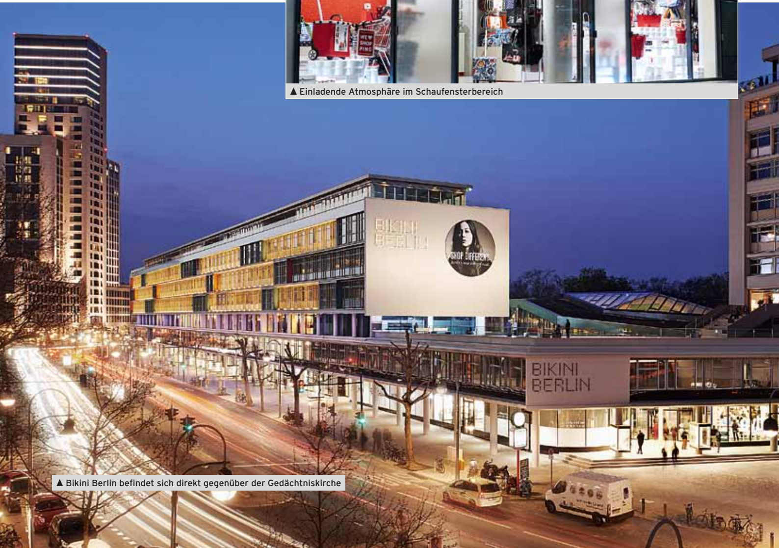
▲ Bikini Berlin befindet sich direkt gegenüber der Gedächtniskirche