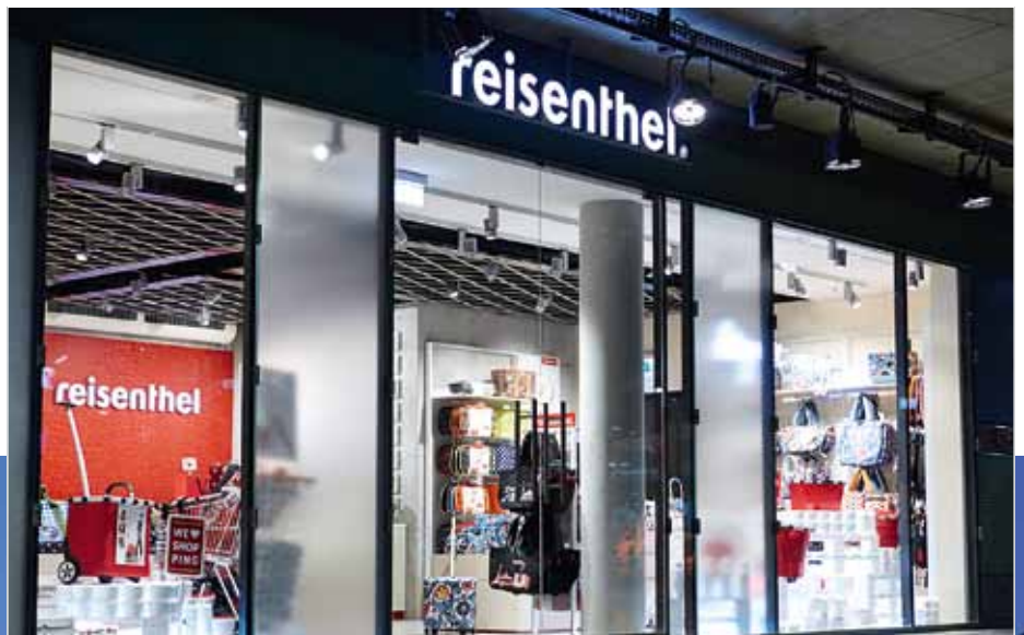
▲ Einladende Atmosphäre im Schaufensterbereich

Galerie umgesetzt. Eine Stoffmusterwand mit sämtlichen Trend-Mustern als Salonhängung entführt die Kunden in die bunte Welt der reisenthel Dekore. Für den Produktklassiker – den carrybag – hat sich die verantwortliche Marken- und Designagentur, die auch für das Shopdesign verantwortlich zeichnet, etwas ganz Besonderes einfallen lassen. Als clevere, leichte Einkaufslösung hat er den traditionellen Weidenkorb abgelöst und einen gebührenden Platz im Store bekommen: die „carrybag-Wand“. Hier werden alle Einzelteile als Installation präsentiert und bieten dem